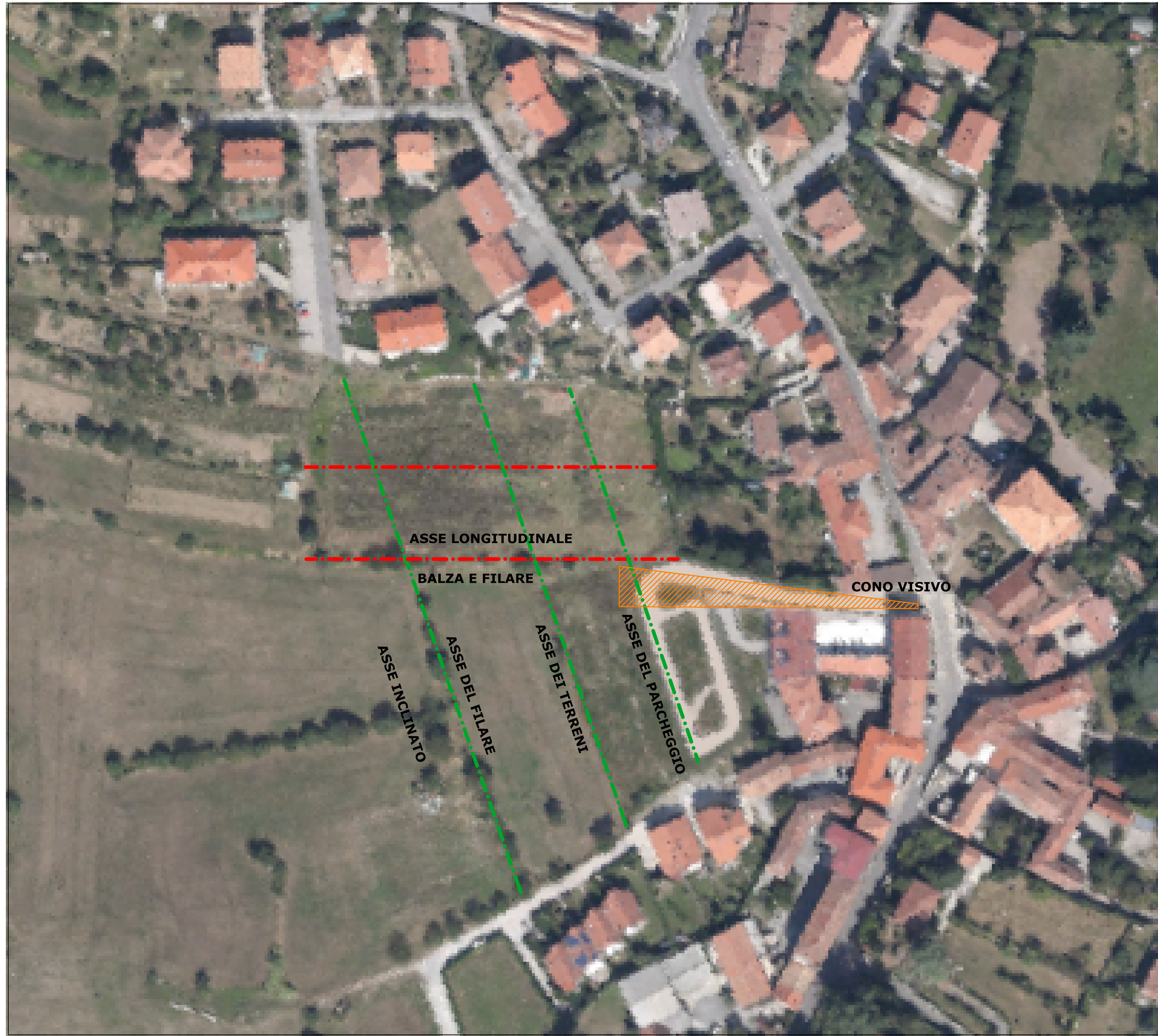
FOTOGRAMMETRICO CON ANALISI DEL TERRITORIO