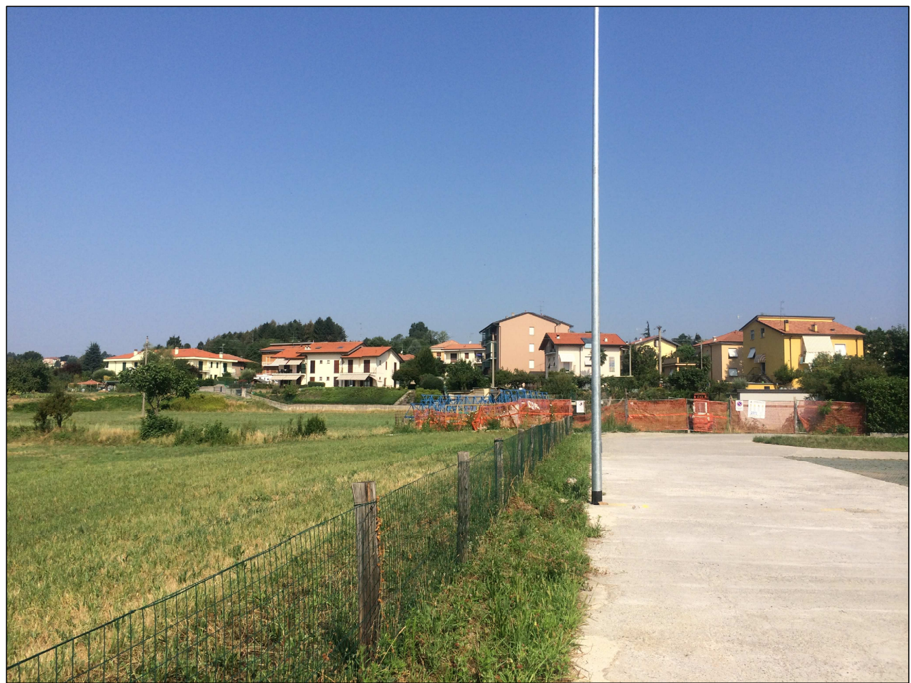
FOTO CON ASSE INCLINATO DEL PARCHEGGIO