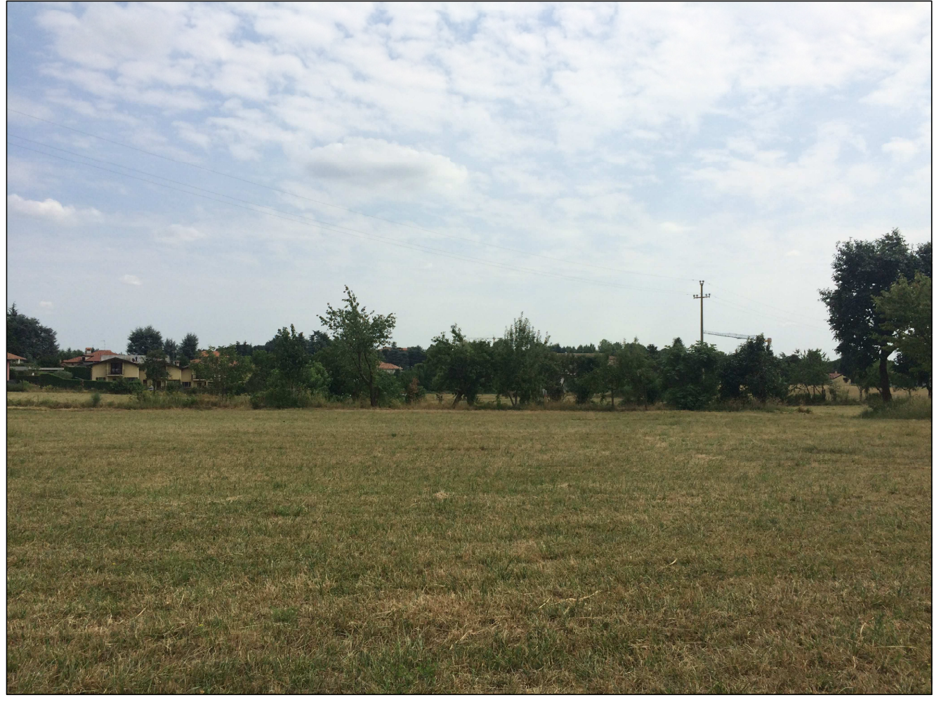
FOTO CON ASSE LONGITUDINALE DEL FILARE